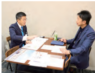
戸田市の未来について語り合いました

工事だけでなく土地や建物のアイデア出しも得意とする工事企画さん。美女木地区に市が保有する空き地の活用案「自販機による冷食スイーツ販売所」を提案いただきました。自販機の導入で人件費などのコストを抑えつつ、現地に食べに来てもらうことで地域に新たな活気が生まれるという構想です。「施設の利益は、食育活動や子ども食堂への支援として公共に還元するといいかもしれません!」「地域支援につなげることで、より親しみを持って利用してもらえるかもしれませんね」など、戸田市の未来のまちづくりに向け、夢のあるアイデアを交換できました。